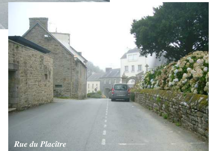
Rue du Placître