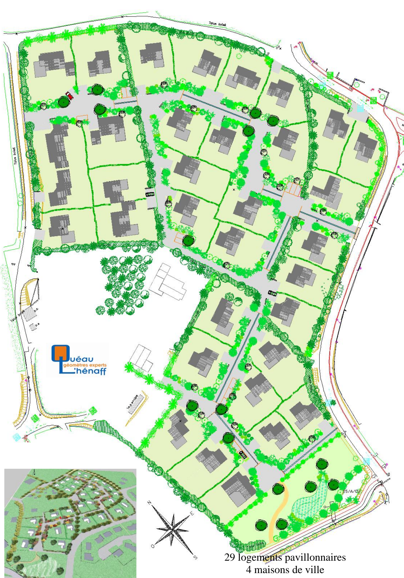
29 logements pavillonnaires 4 maisons de ville

Cette conception permet aux résidents de pouvoir se promener dans le quartier, telle que pourrait être une balade dans un parc.