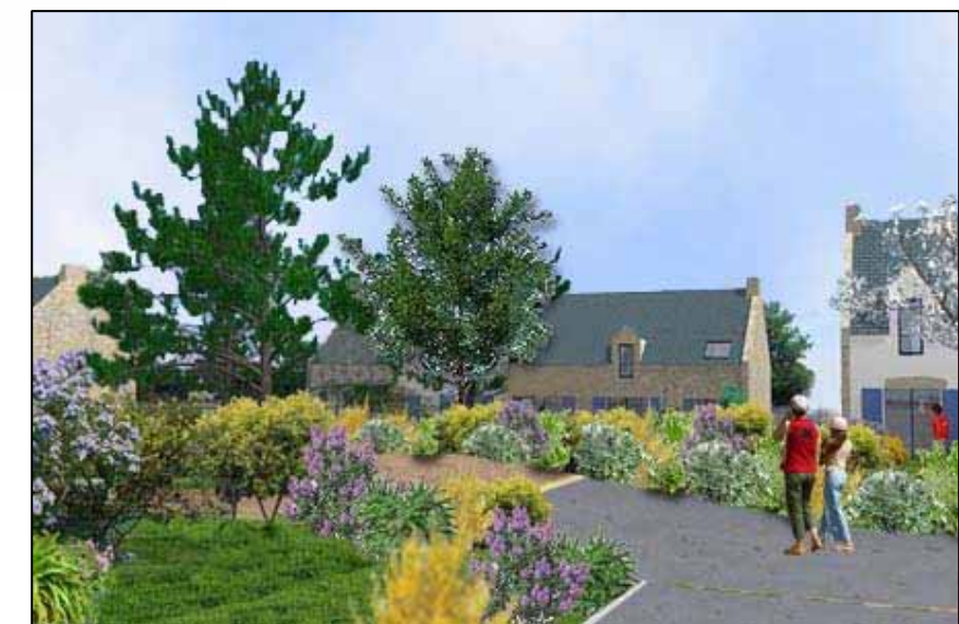
Photomontage de l'espace public

Réseau piétonnier : les cheminements piétons, largement représentés dans le nouveau quartier permettent de relier les divers sentiers existant (à l'Est et sur les trottoirs de la VC au Nord Ouest). Les promeneurs se trouvant sur la VC n°4 pourront très facilement utiliser le réseau de circulation douce du nouveau quartier en empruntant la coulée verte et ainsi rejoindre le chemin menant au bourg au Sud.