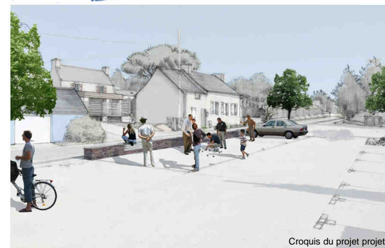
Croquis du projet projeté