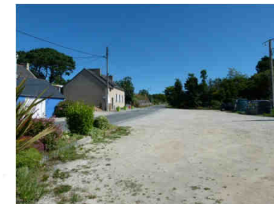
Photo de l'existant

• Projet faisant l'objet d'une demande de subventions au titre du dispositif Patrimoine et Cadre de Vie.